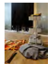
Autogordels, spantakken en autogordels worden verwerkt tot objecten die doen denken aan schilderingen van architectonische gebouwen en geometrische omgevingen.

naar de boek loopt waar een rij autogordels aan de muur hangt. "Maar ik voel me steeds meer thuis bij mijn technische kant. Nu bijvoorbeeld met autogordels, waarbij ik mijn fascinatie voor de structuur van die rechte waal verwerk in twee- en drie-dimensionale werken. Het mooie van de structuur van autogordels is dat wat je ziet steeds verandert, afhankelijk van de invalshoek. De vlechtstructuur heeft tegelijkertijd een heel diep gevoel, het is een stof die je in de auto vaak gelaatsloos omgeeft. Maar verwerkt in een kunstwerk kan deze een fascinerende krijgen. Ik ben nu bezig om de stof rond een hoeken om te spinnen voor een werk dat ik in Laren wil tentoonstellen. Ook bij spantakken die ik gebruik zie je, zeker als die banden en gewichtende hebben gehad, allemaal af structuur ontstaan als je ze naast elkaar plaatst. Dan komt het tot leven. Ik maak gebruik van de eigen zeggingskracht van het ruwe materiaal. Zo ben ik ook ik bijvoorbeeld grote lagen jute, die ik vervolgens in repen snijd en weer in elkaar vlecht. Ook hier zijn het weer materialen die we allemaal kennen, maar die je moet zien vanuit het perspectief dat ik aanbreng."