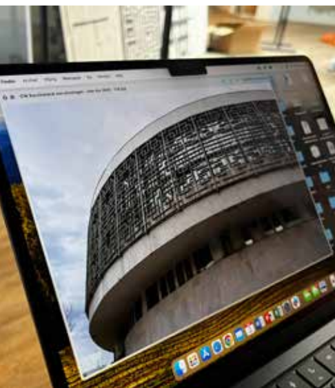
Waaijer is gefascineerd door de brutalistische Sovjet-architectuur, waar hij op stuitte tijdens een reis naar Kazachstan.